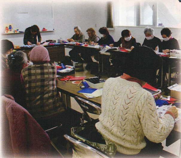
おりがみ教室の風景