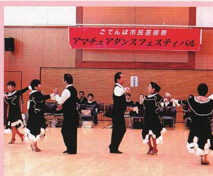
アマチュアダンスフェスティバル