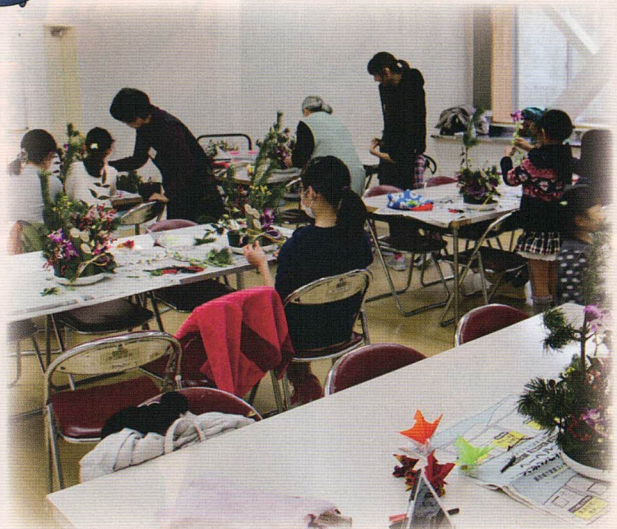
子どもフラワーデザイン教室の風景