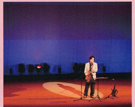
ほのぼのコンサート