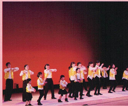
ジュニアフェスティバル