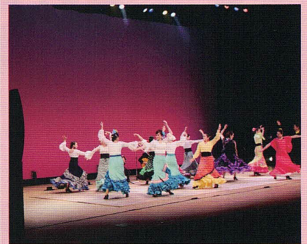
洋舞フェスティバル