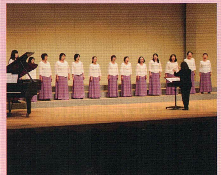
コーラスフェスティバル