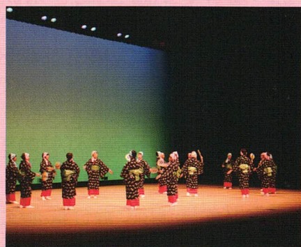
日本芸能のつどい