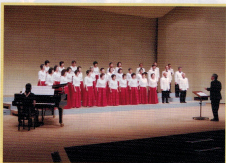
コーラスフェスティバル 7.5(日)