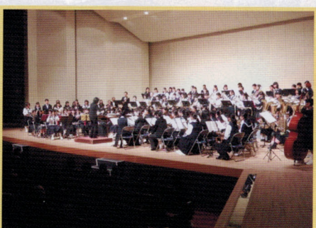
吹奏楽のつどい 10.12(祝)