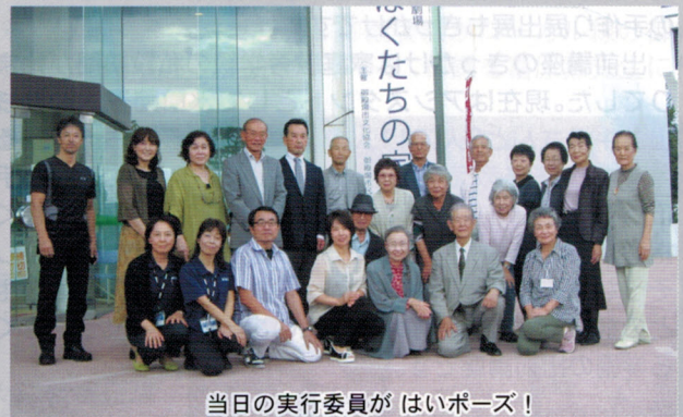
当日の実行委員が はいポーズ!