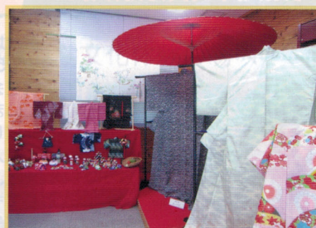
和装作品展示 10.31 (土)～11.1 (日)