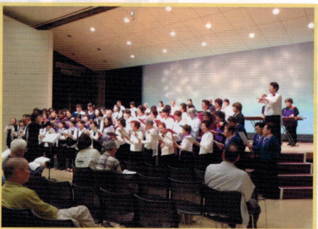
ほのぼのコンサート 9.27(日)