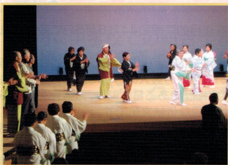
日本芸能のつどい 10.18 (日)