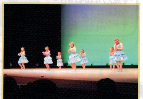
ジュニアフェスティバル 8.9(日)