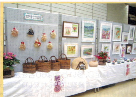
文化展 11.13 (金)～15 (日)