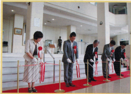
オープニングセレモニー 6.13(土)