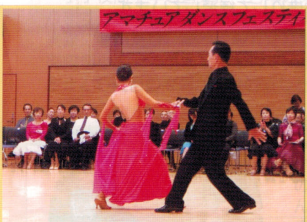
アマチュアダンスフェスティバル 11.15 (日)