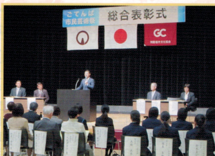
総合表彰式 10.31 (土)