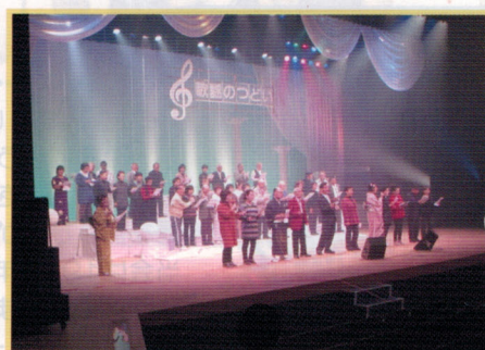
歌謡のつどい 11.14 (土)