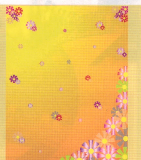
10.10 (土)～18 (日)